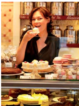
Im Reich der süßen Schokoladenträume: GÖTTERSPEISE

Jedes Jahr die Qual der Wahl, eigentlich haben viele schon alles und zwar in Hülle und Fülle. Trotzdem ein paar Geschenkideen zum Fest.