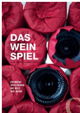
Wissen, Kultur und bes- te Unterhaltung: DAS WEINSPIEL