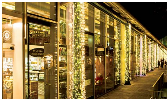
Erstrahlt im neuen Gewand auch zur Adventszeit: SCHRANNENHALLE

diese ist auch heuer wieder zu Gast am Isartor. Natürlich lohnen sich auch Besuche des Weihnachtsmarkts auf der Praterinsel und des Bogenhausner Weihnachtszauberwald , sowie das kulinarisch-kulturelle Programm des Tollwood-Festivals . Kultur wird auch im Gasteig Weihnachtswald geboten: ein künstlerischer Adventskalender präsentiert Jazz-, Blechbläser- und Liedermacherkonzerte, dazu gesellen sich Geschichtenerzähler. Am 22. und 23. Dezember werden hier darüber hinaus Weihnachtsbäume für einen guten Zweck versteigert. Weitere Weihnachtsmärkte (auch im Umland) siehe Kasten auf linken Seite.